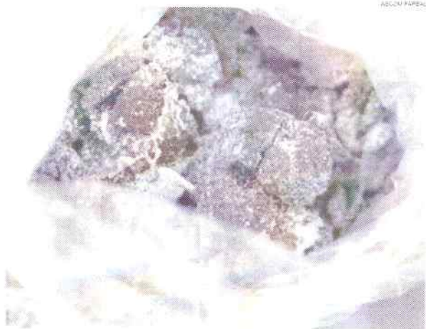
Relatório do Governo de Alagoas garante o anexo de dados a cada dois meses de material coletado

No fim deste ano de 2019, o monitoramento foi realizado em sete pontos estratégicos, devido às condições climáticas da época, que não permitiu o avanço do trabalho em pontos estratégicos.